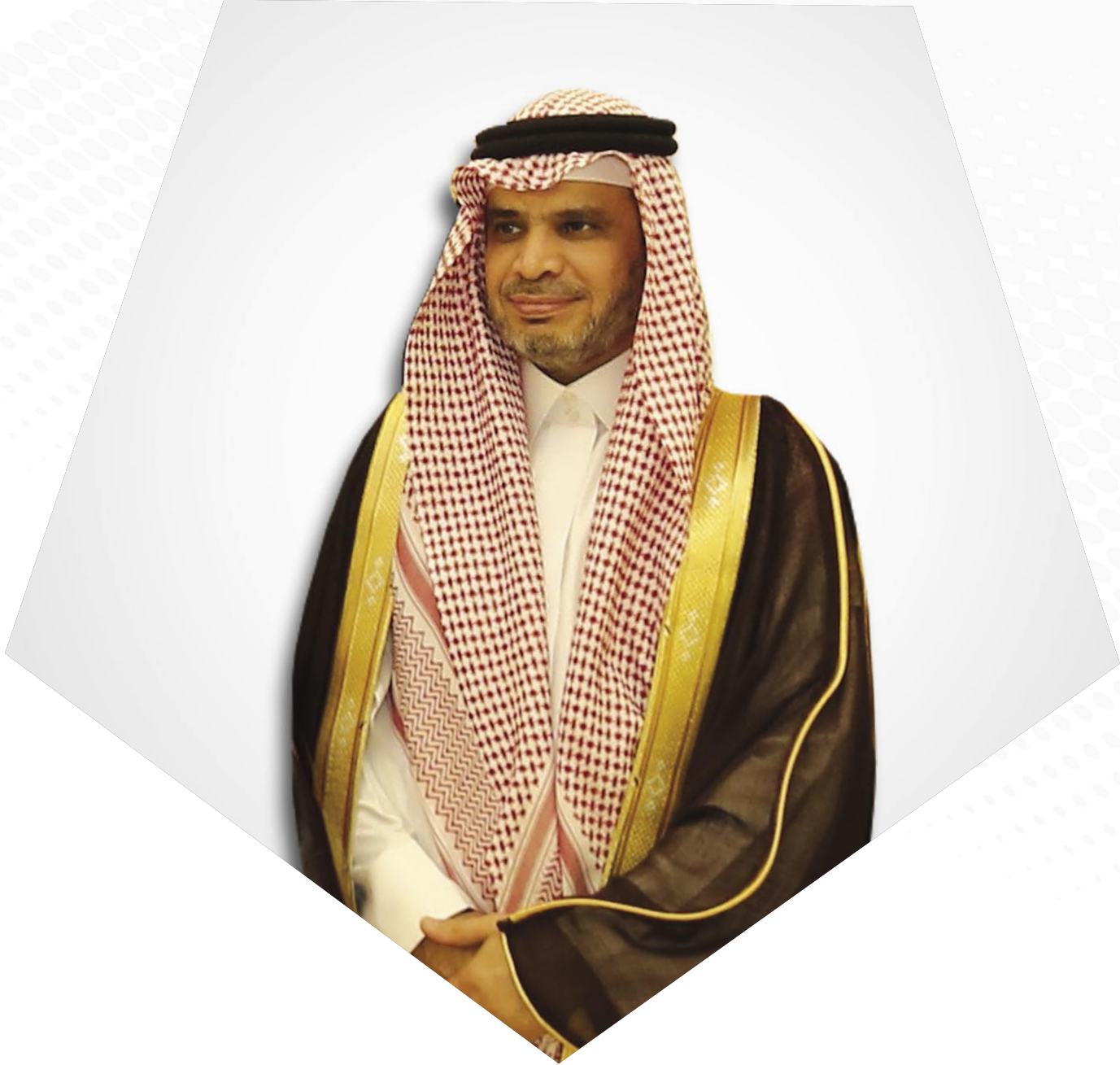
د. أحمد بن محمد العيسى وزير التعليم